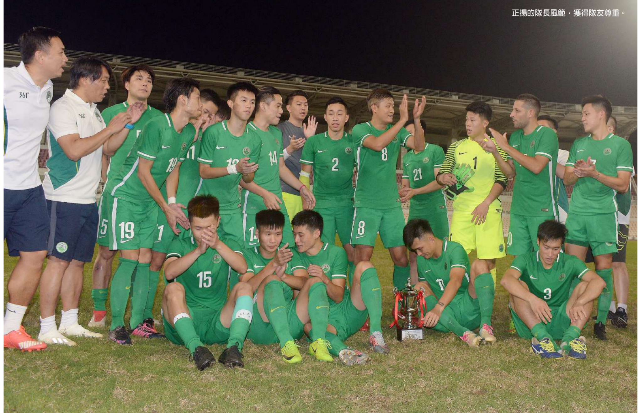
正揚的隊長風範，獲得隊友尊重。