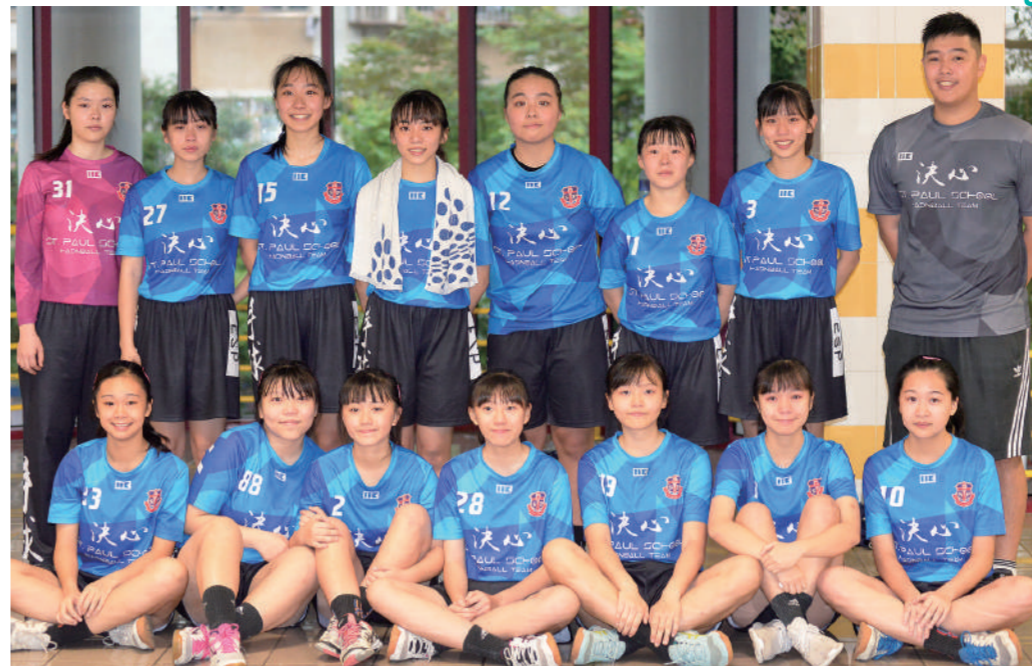
經歷過去兩屆挫折，聖保祿女子隊終於圓夢。