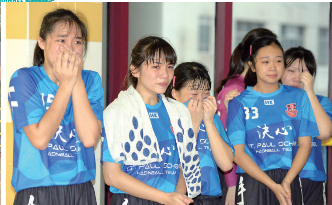
聖保祿女子隊賽後流下依依不捨的眼淚