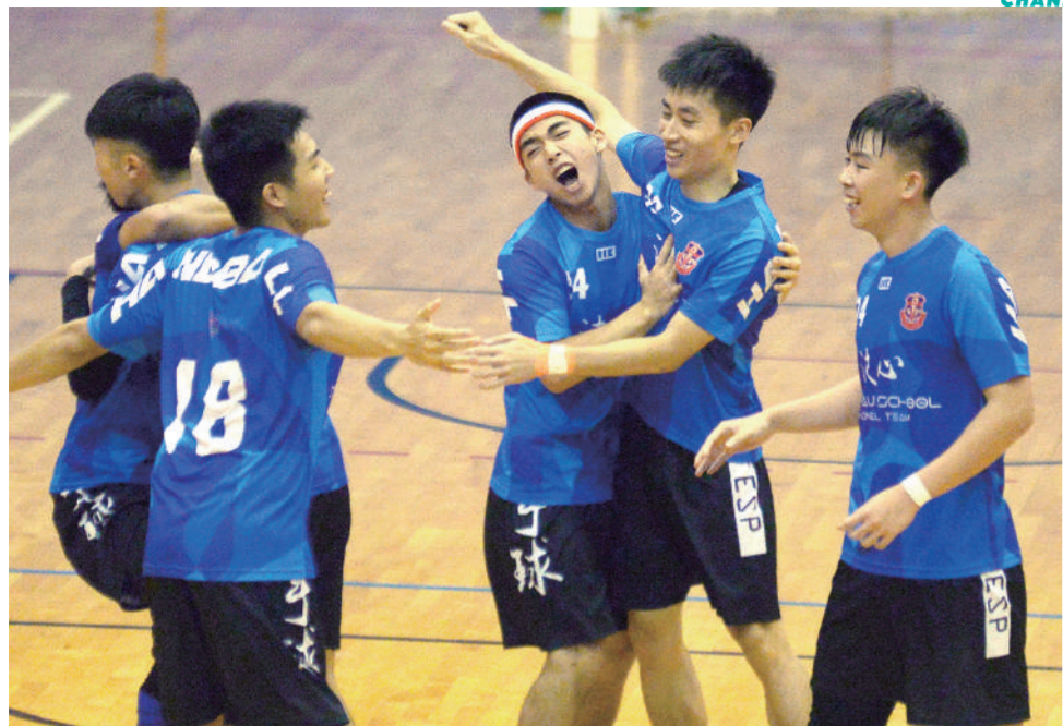
聖保祿A封王一刻相當激動