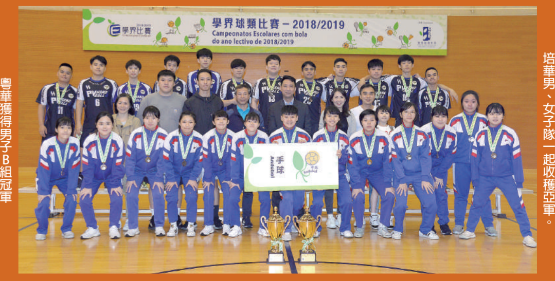
培華男、女子隊一起收穫亞軍。