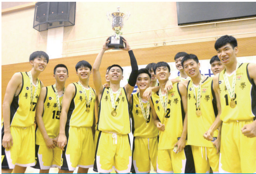
粵華完成學界籃球五連霸再捧冠軍獎盃