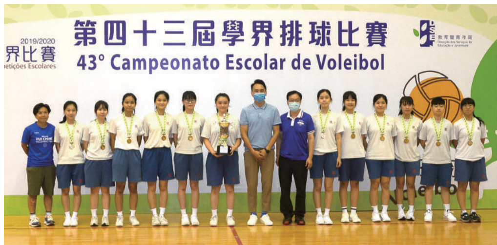
教育局副局長龔志明向培正女排頒發女A冠軍獎盃