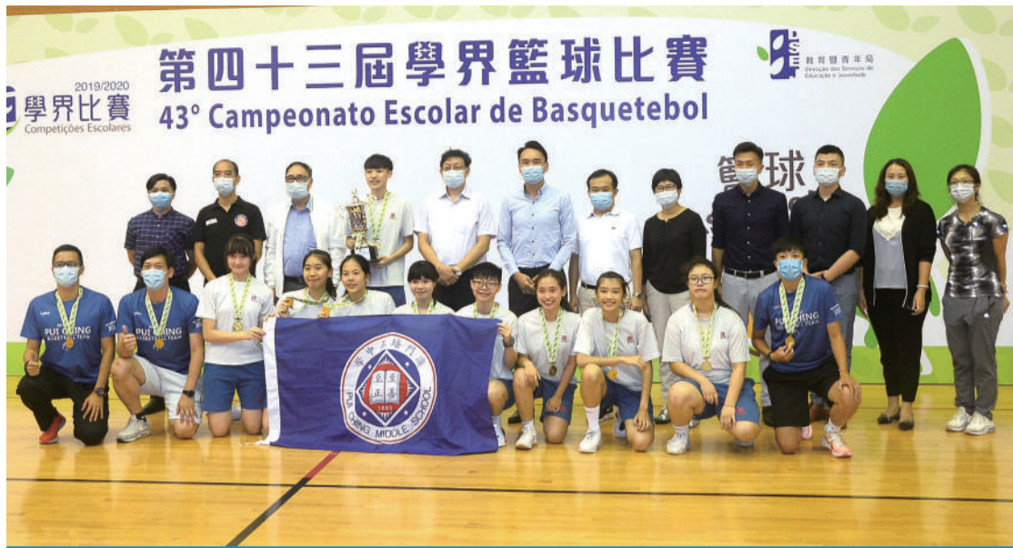
培正相隔一年重奪學界籃球女A冠軍