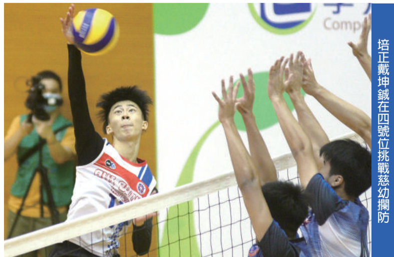
培正戴坤鉞在四號位挑戰慈幼攔防

今屆學界排球男、女A季軍分別由粵華及永援獲得，其中粵華激戰五局下以局數3比2擊敗培華，永援則直落三局擊敗利瑪竇。