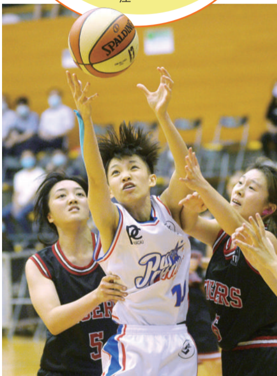
培正楊遠瑩爭搶籃板