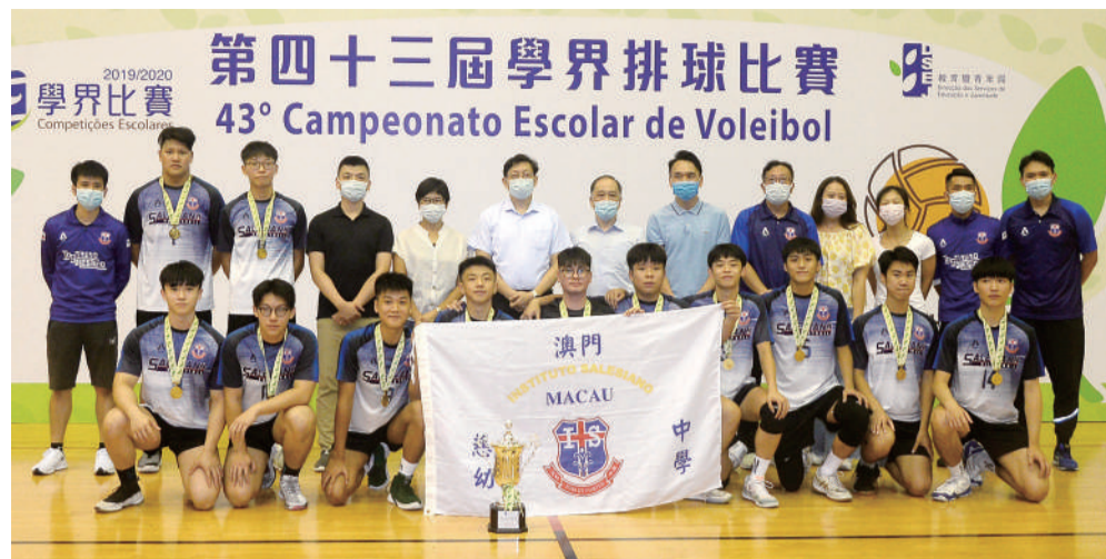
慈幼A從教育局局長老柏生手上接過冠軍獎盃