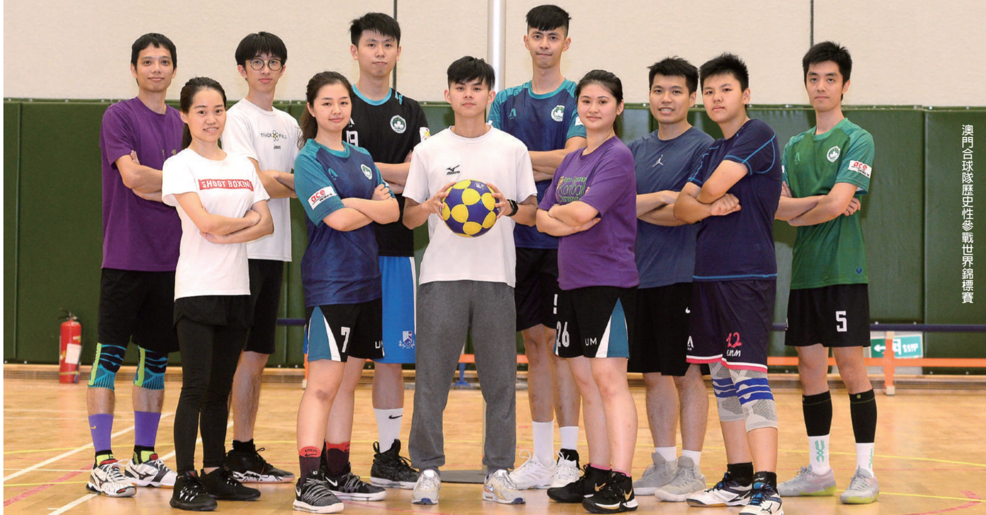
澳門合球隊歷史性參戰世界錦標賽

中國澳門合球總會自二〇〇一年成立以來，雖一直未能成為體育局認可的體育總會，但一班球員過去二十年間即使長期面臨資源短缺問題，仍努力參與訓練、自資出外參賽，為的就是要拚盡所有，實踐參戰世錦賽的夢想。去年，合球隊在亞洲暨大洋洲合球錦標賽共二十支參賽隊伍中奪得第七名，與世錦賽資格僅差兩席，基於多明尼加及津巴布韋放棄參戰，澳門合球隊終於以後補身份歷史性獲得參戰八月南非世錦賽的資格！即使再次面對龐大參賽費用，球員仍決心珍惜踏足世界舞台的機會，讓世界各國見識到澳門合球隊如何憑毅力及熱誠，闖進最高級別合球戰場。