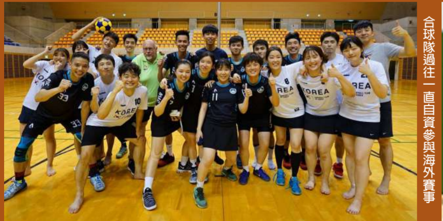
合球隊過往一直自資參與海外賽事

“2019世界合球錦標賽”將於本年八月一日至十日於南非德班舉行，世界列強隊伍荷蘭、中華台北、比利時、中國、德國等悉數列席，賽事首階段將分為五個小組進行循環戰，每個小組首三名及積分最高隊伍將進入第二回合，未能出線的四隊將以單循環決定十七至二十名的世界排位。抽籤後排在D組的澳門隊與中國、匈牙利、蘇里南交鋒，澳門隊目前世界排名三十位，為參賽二十隊中排名最低的隊伍，但球員目前士氣