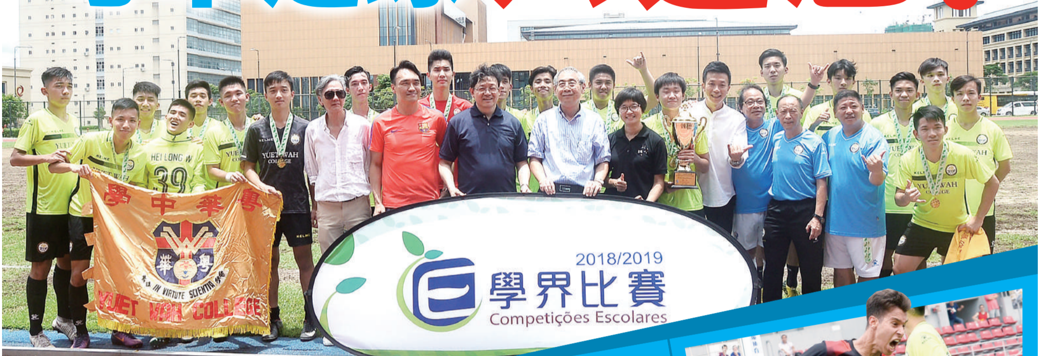
粵華締造學界A組足球六連冠神話