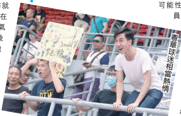
粵華球迷相當熱情