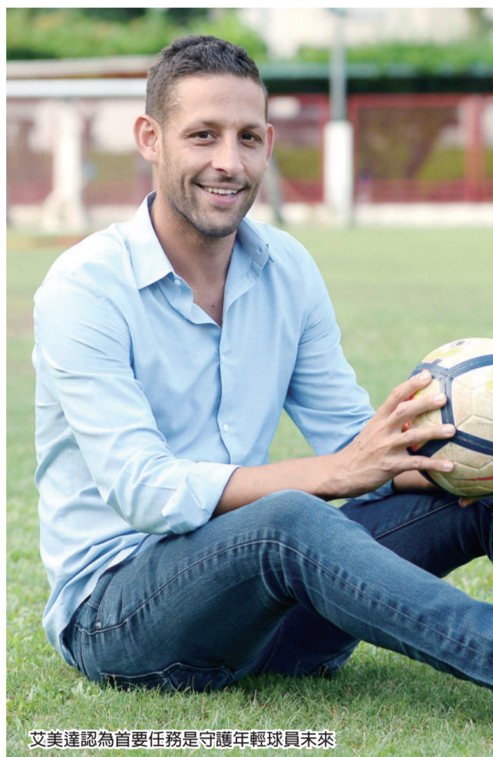
艾美達認為首要任務是守護年輕球員未來