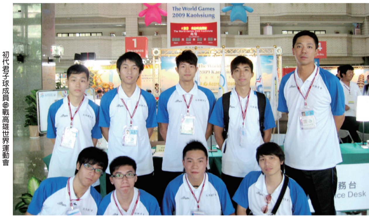
初代君子球隊成員參戰高雄世界運動會