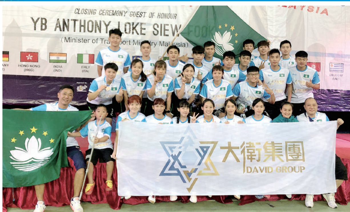
澳門男、女子君子球隊去年登上世界第四及第七位。