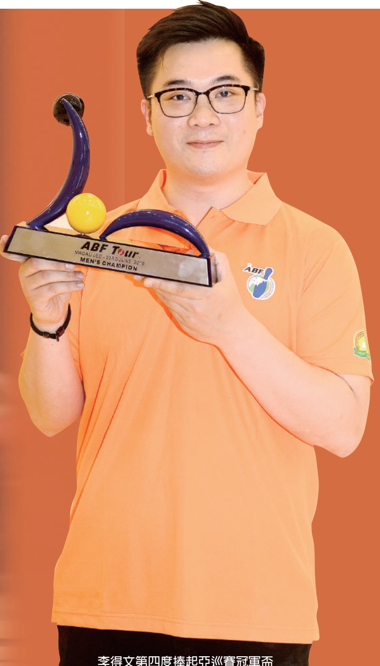
李得文第四度捧起亞巡賽冠軍盃