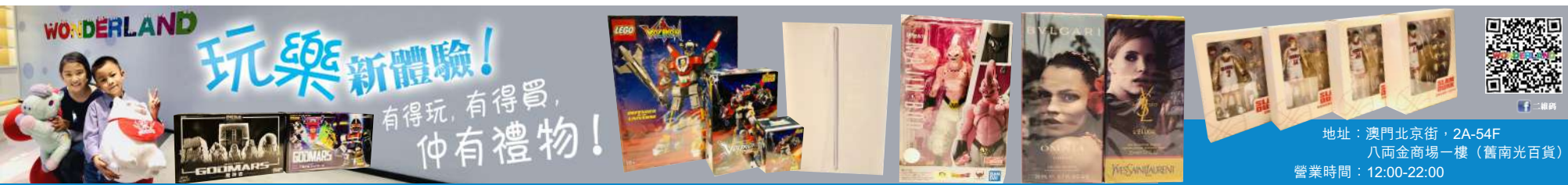
地址：澳門北京街，2A-54F 八間金商場一樓（舊南光百貨） 營業時間：12:00-22:00