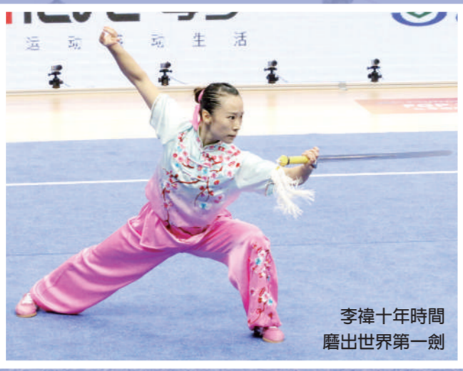
李禕十年時間 磨出世界第一劍