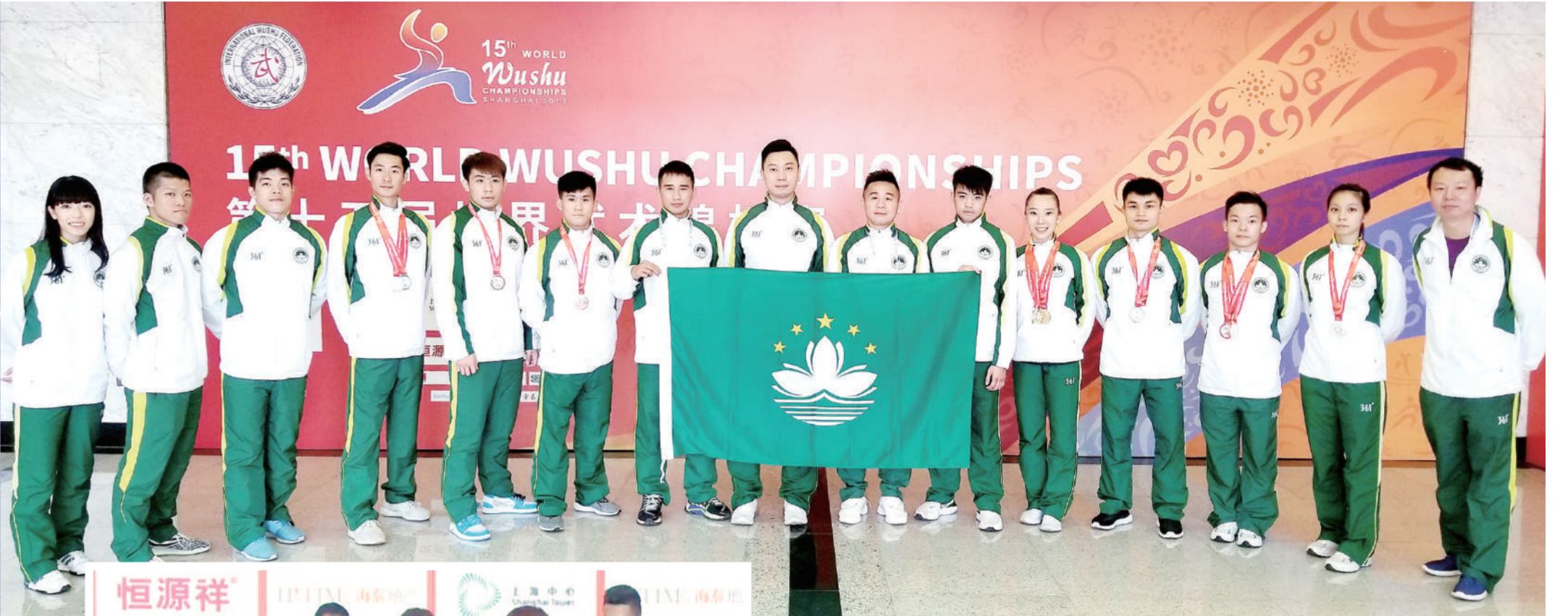
武術隊在上海世錦賽賽場合影