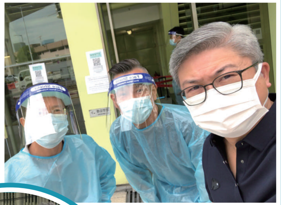
體育局局長潘永權(右)到場鼓勵