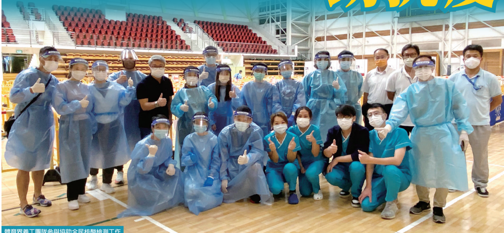
體育界義工團隊參與協助全民核酸檢測工作