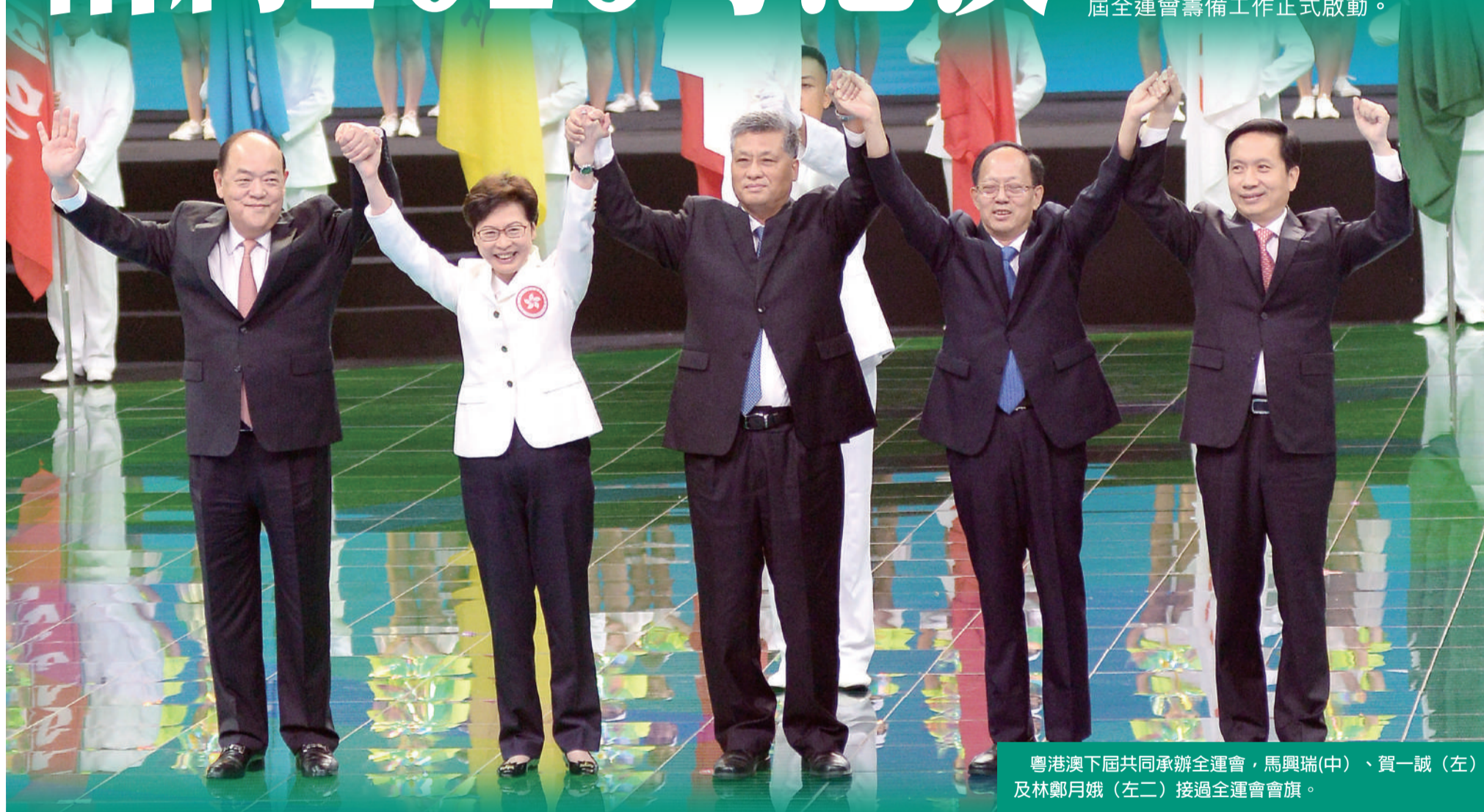
粵港澳下屆共同承辦全運會，馬興瑞(中)、賀一誠(左)及林鄭月娥(左二)接過全運會會旗。

第十四屆全國運動會九月廿七日晚在陝西省西安市落下帷幕，澳門體育代表團參與在奧體中心體育館舉行的閉幕式。閉幕式期間進行全運會會旗交接儀式，澳門特區行政長官賀一誠聯同廣東省省長馬興瑞、以及香港特區行政長官林鄭月娥共同接過會旗，標誌著粵港澳三地合力承辦的第十五屆全運會籌備工作正式啟動。