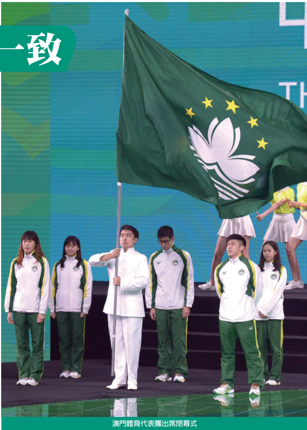
澳門體育代表團出席閉幕式