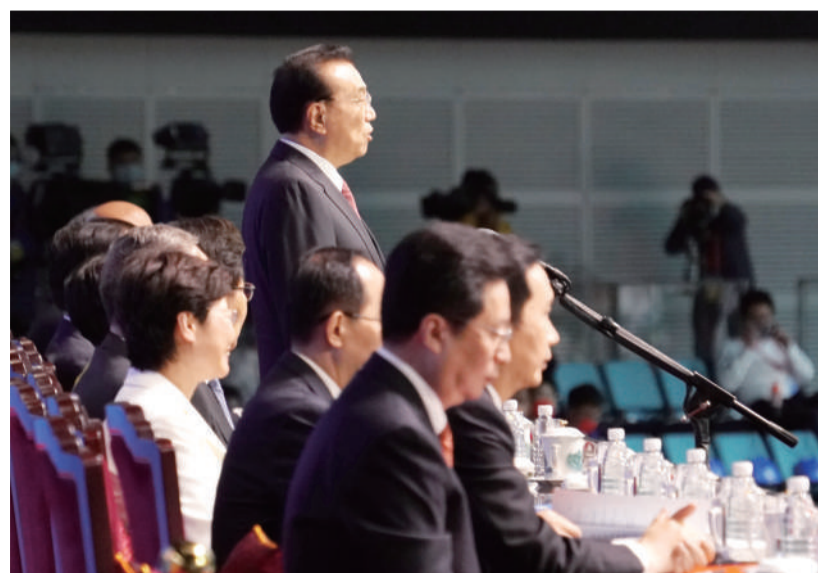
國務院總理李克強宣布十四運會閉幕