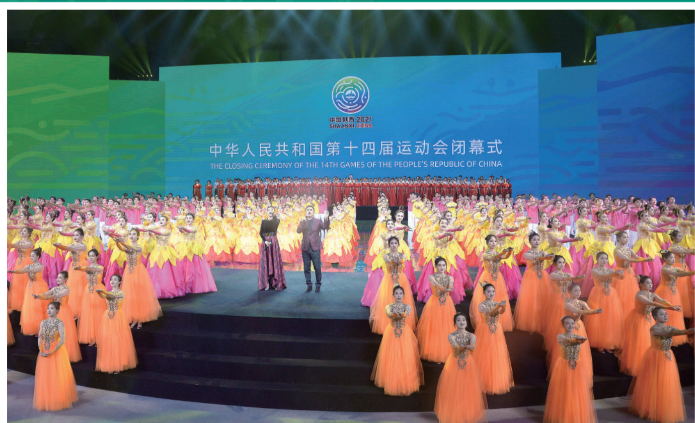
閉幕式上演多場文藝演出

閉幕式一如以往安排各代表團進場，澳門體育代表團第六隊進場，禮儀人員揮舞著特區區旗，帶領留守到最後的游泳隊代表入場。隨後上演連場歌舞及文化表演，為今屆全運會劃上句號。