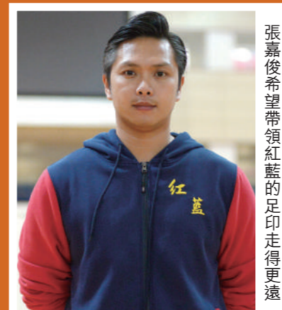
張嘉俊希望帶領紅藍的足印走得再遠

未到最佳水平，所以我覺得球員今仗發揮其實可以做得更好；而且今屆有媒體直播，大家未免有點緊張。」