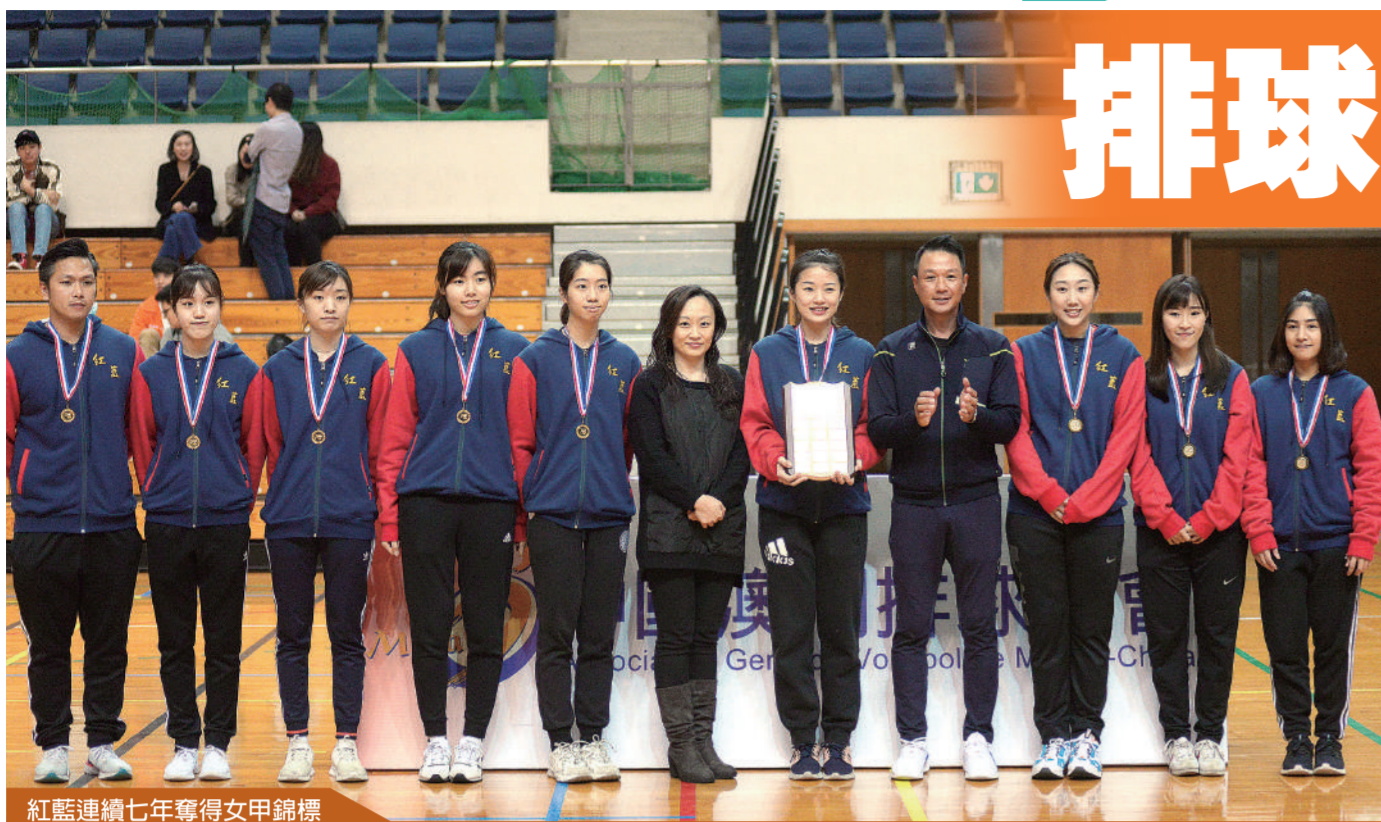
紅藍連續七年奪得女甲錦標

全澳排球聯賽煞科，今屆不但在賽制上全面革新，男甲及女甲決賽更加首次在理工體育館全程直播。小組賽曾經輸給對手的友樂A以第二梯級資格躋身決賽，並一舉向慈青復仇，沒有給予任何機會下直落三局取勝，相隔一季後重奪男甲錦標。女甲依然是紅藍的天下，以局數三比〇零封鳴吳稱霸，延續七連冠王朝。