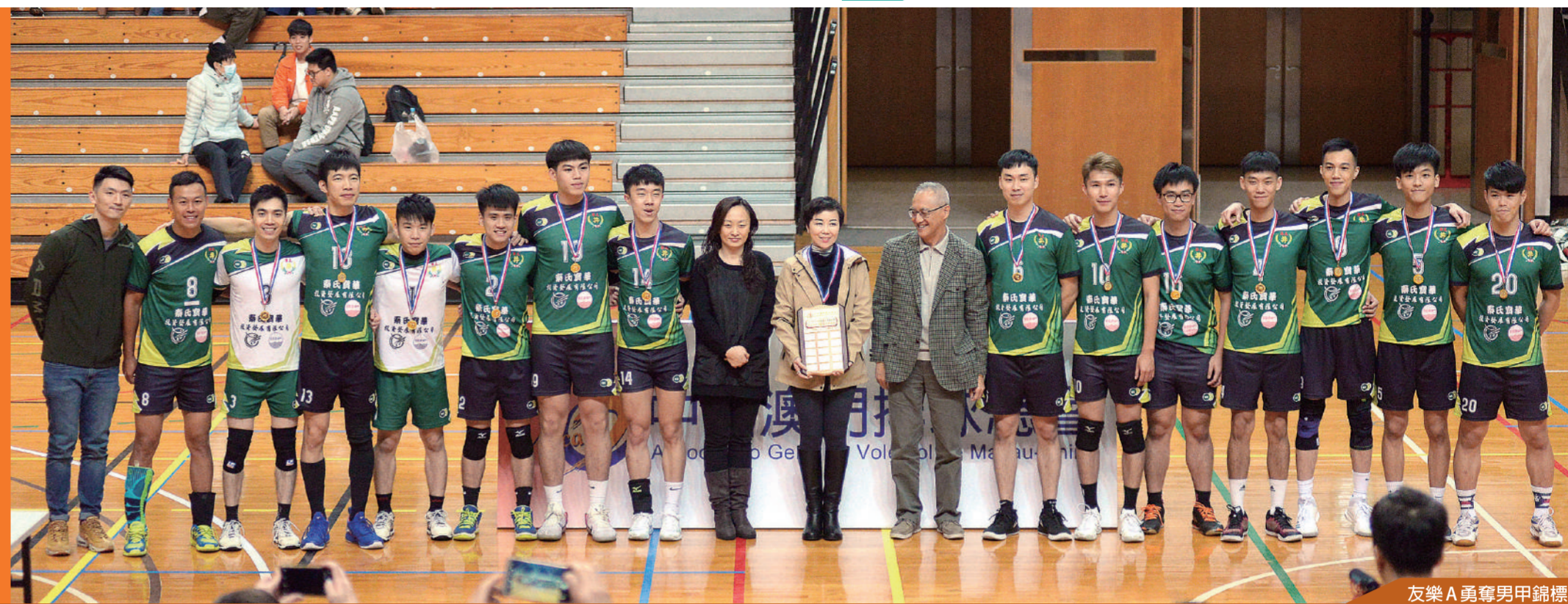
友樂A重奪男甲錦標